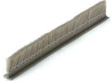
▲倒れ防止糸付きモヘア