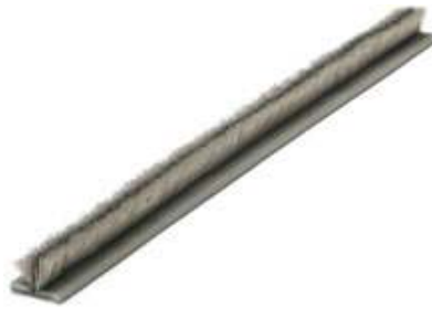
▲フィン付きモヘア