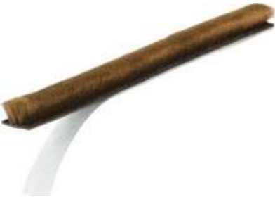
▲テープ付きモヘア