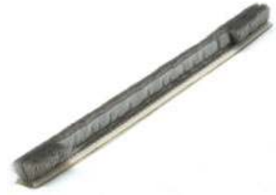
▲フィン付きモヘア(断面)