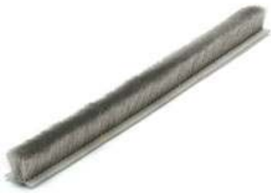
▲汎用タイプモヘア